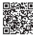
▲メルマガ受付ページ