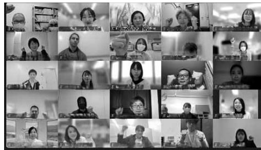
1/15 ネットワーク会議の様子

県内全域にわたり、日本人と外国人が対等な関係を築きながら学び合うことができる「地域日本語教室」の推進を目指し、ワンチームとなって事業を進めていきたいと思えます。