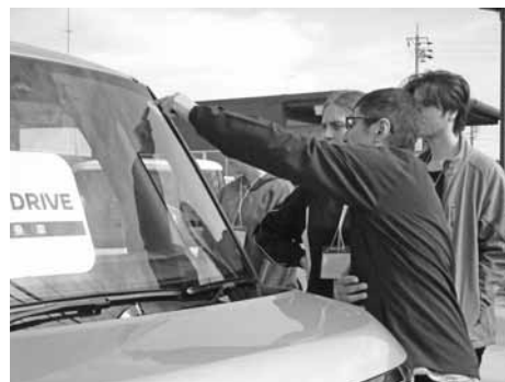
浜松日産自動車 磐田豊田店

どの体験先でも生徒たちはとても緊張しており、始めは挨拶をするのが精一杯でしたが、体験先社員の指示に従い作業を体験することで少しずつ笑顔が見られるようになりました。体験後の振り返りでは緊張で事前に用意していた質問ができずに終わってしまったという生徒もいましたが、「自動車整備士になる方法が分かった」、「働いている人は自分の仕事に誇りを持っている」、「事故や不良を防ぐための細かな作業が大事だと知った」、「働いている人の笑顔が素敵だった」等様々な感想が聞かれました。何より、多くの生徒が自身の体験を通して「日本語をもっと勉強しないとイケない」という気づきを得る機会となりました。