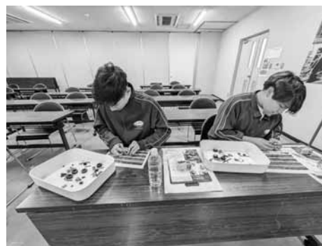
浜松日産株式会社