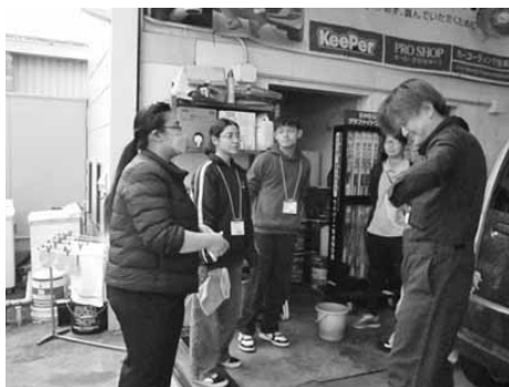
第一商事株式会社